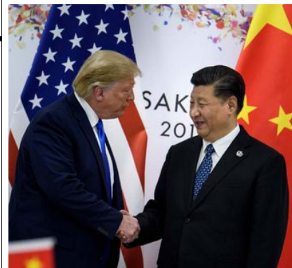
NYTT FORSØK: USAs president Donald Trump og Kinas president Xi Jinping møttes i forbindelse med G20-toppmøtet i Osaka i Japan lørdag.