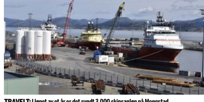
TRAVELT: I løpet av et år er det rundt 3.000 skipsanløp på Mongstad.

– På oppmøtningssjefen vil lokale hygningsarbeidere i ferd med å støpe betongfundament og legge armeringsjern til det nytt bygg. I en annen del av tomtene er fjell sprengt ut, og anleggsmaskiner står klare til å planere området.